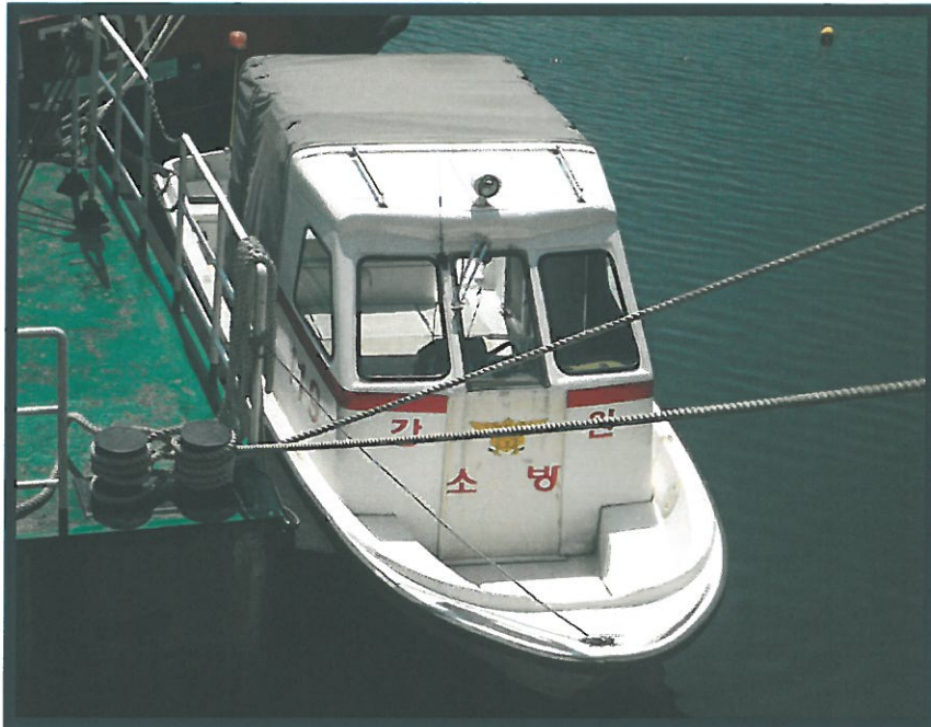
강원 701호 보조정 (보트) 전경