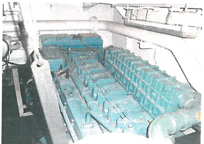
강원 701호 주기관