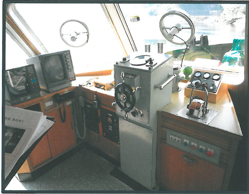
강원 701호 조타실