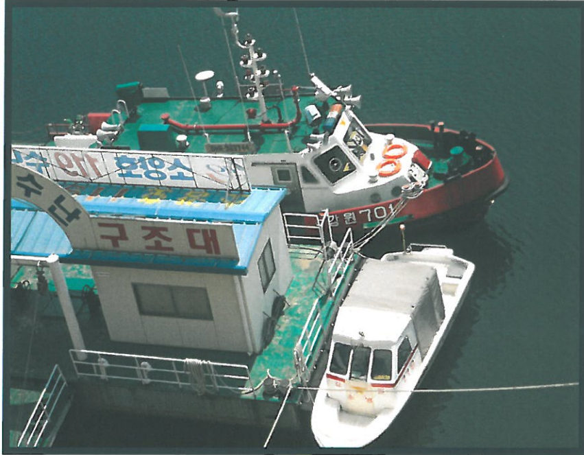
강원 701호 (소방정) 및 보조정 (보트) 원경