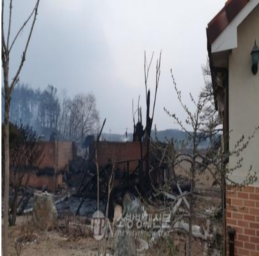
소실된 주택 3채