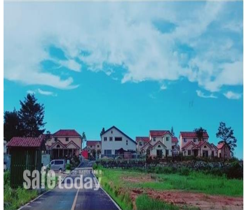
화재방어에 성공한 주택 19채