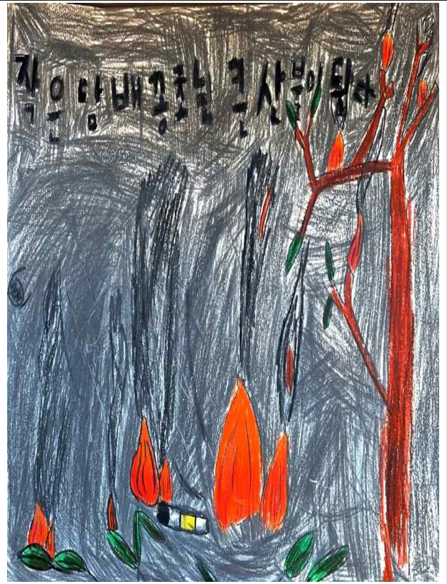
양양초등학교 1학년 2반 정서울